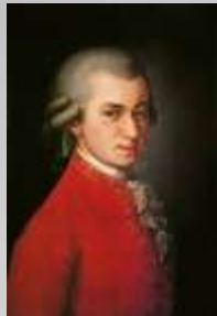
Вольфганг Амадей Моцарт