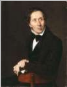
Ганс Крістіан Андерсен