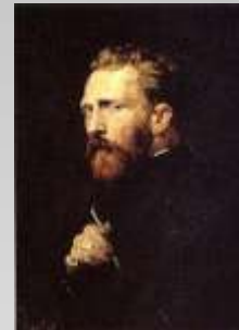
Вінсент Ван Гог