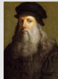
Леонардо да Винчи